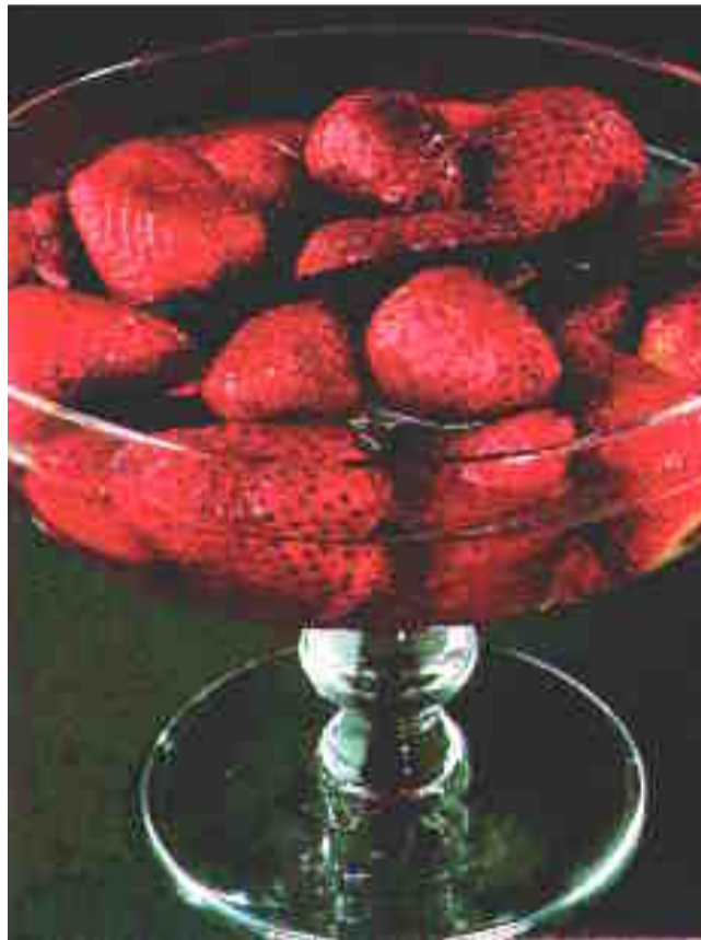
Pozno spomladi in poleti lahko poživite spolno življenje z zobanjem presnih jagod, ki morda krepijo spolno moč in poželenje.

Ženskam, pri katerih se izloča premalo estrogena, makrobiotiki priporočajo, naj jedo manj hrane živalskega izvora, več pa zelenolistnate zelenjave.