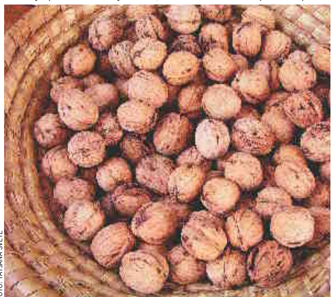
Tudi presna orehova jedrca so naravni afrodiziak.